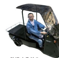
改造する前の光岡自動車「Like-T3」