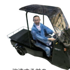
改造する前の光岡自動車「Like-T3」